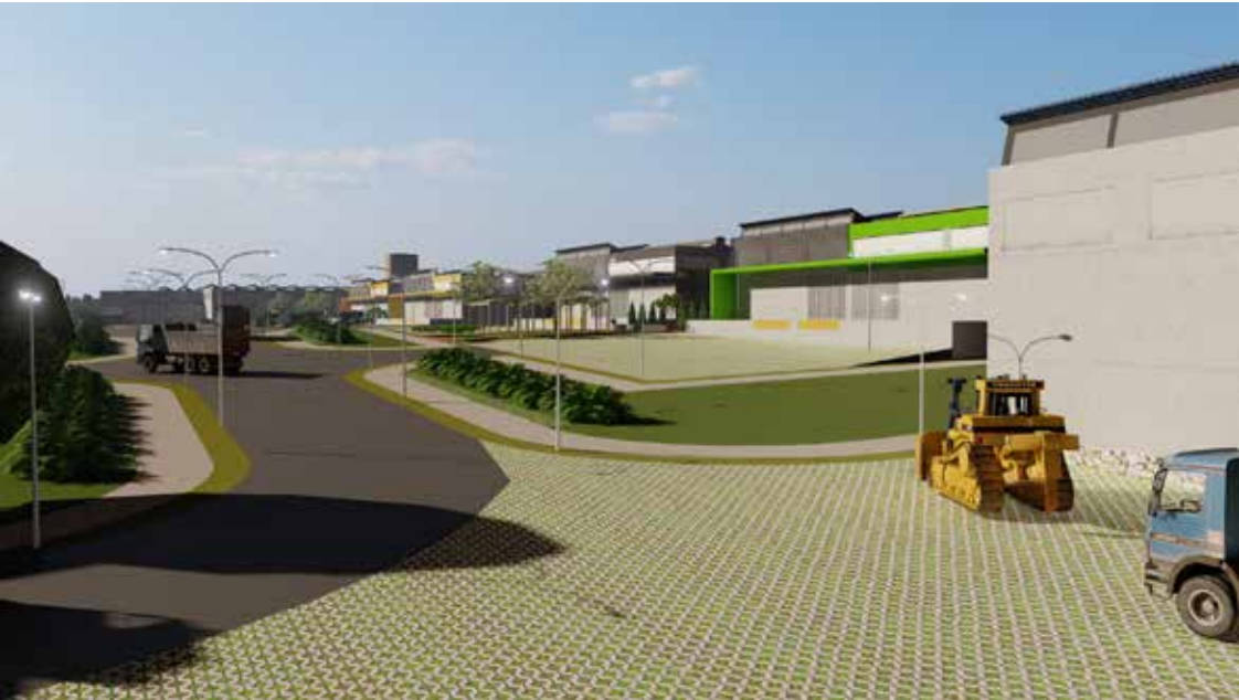
Figura: Vista da Via 04 - Setor de Produção e Processamento