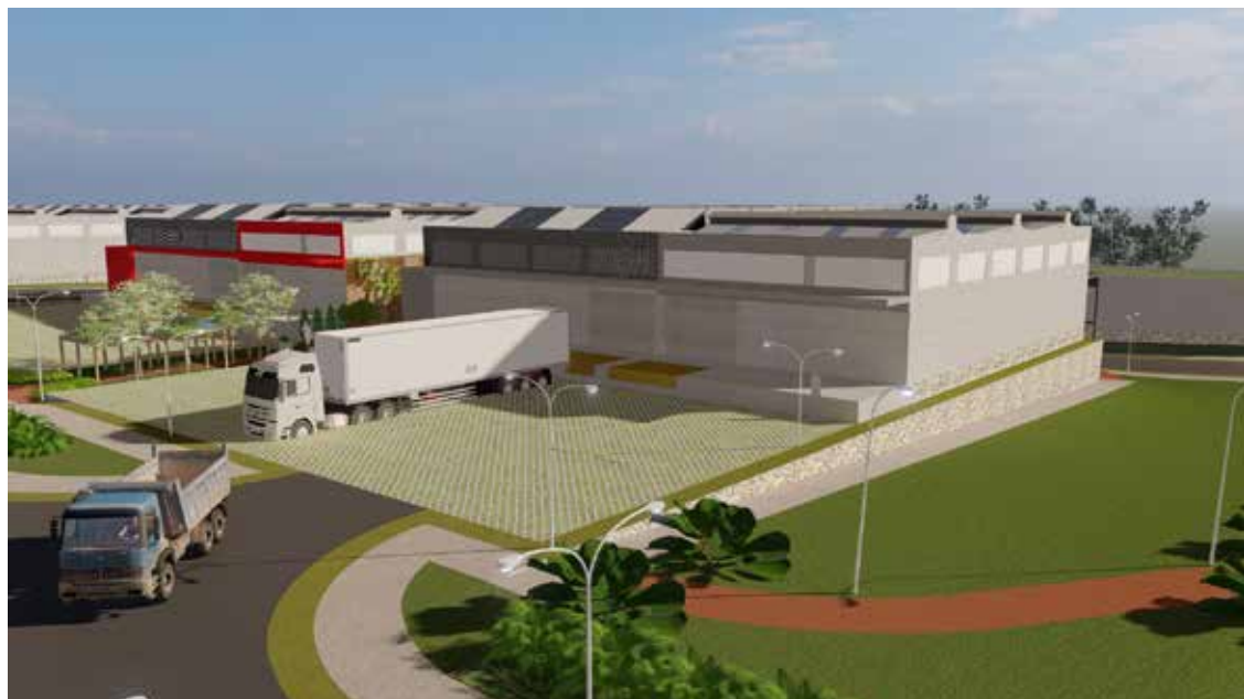
Figura: Perspectiva do Galpão Tipo