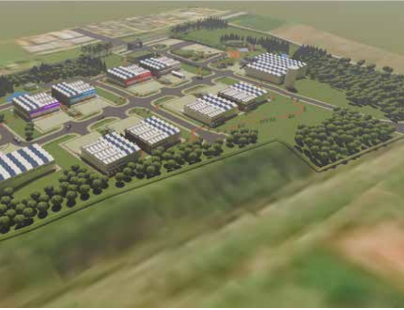
Figura: Perspectiva Geral do complexo