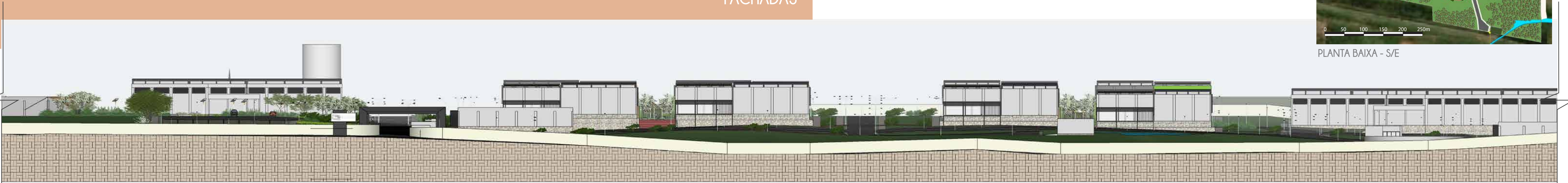
FACHADA NORTE - 1/500