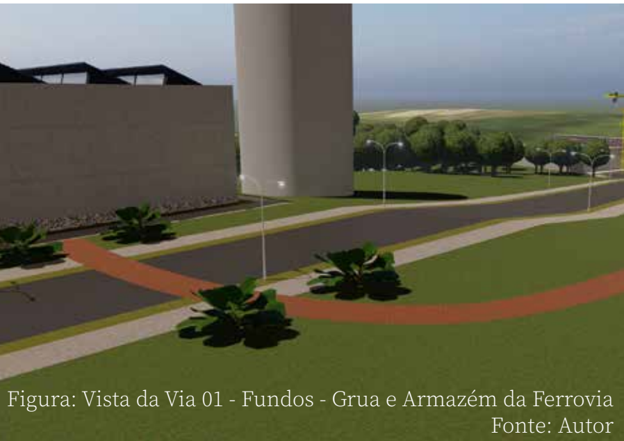
Figura: Vista da Via 01 - Fundos - Grua e Armazém da Ferrovia