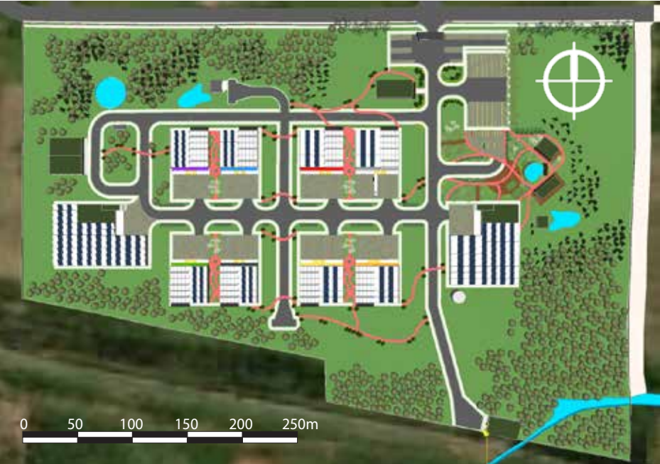
PLANTA BAIXA - S/E