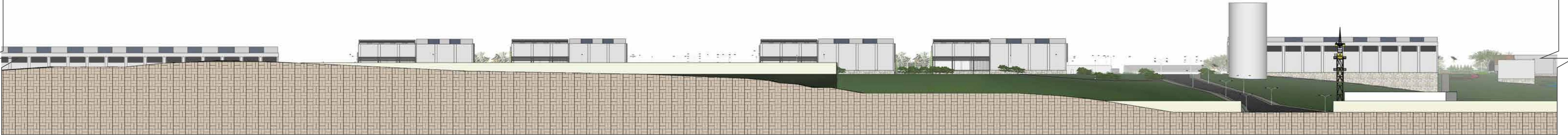
FACHADA SUL - 1/500