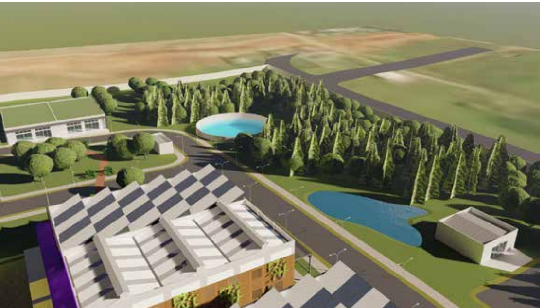
Figura: Perspectiva do Açude Técnico e Cisterna