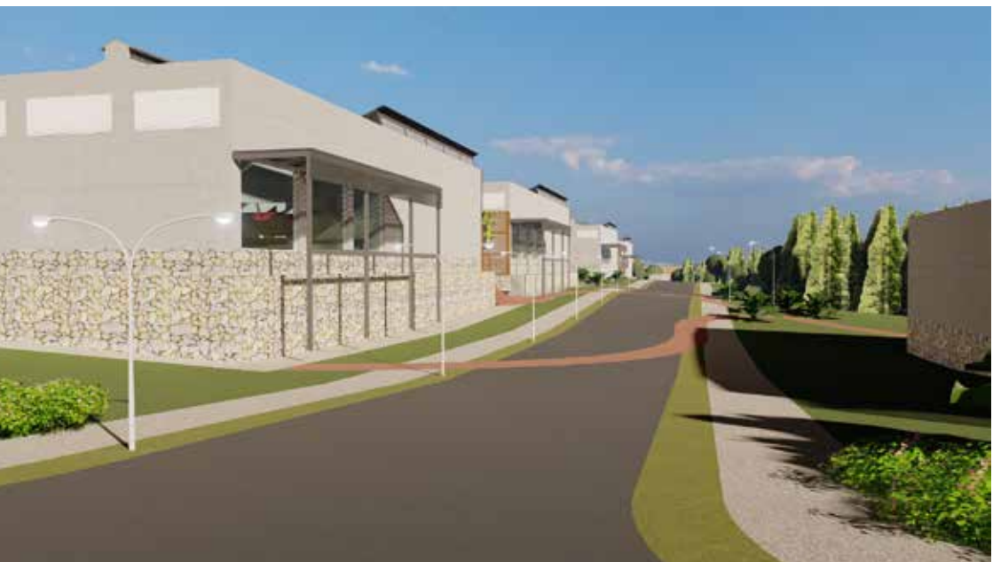
Figura: Vista da Via 02 - Fundos do Setor de Produção e Processamento e frente de Setor de Utilidades